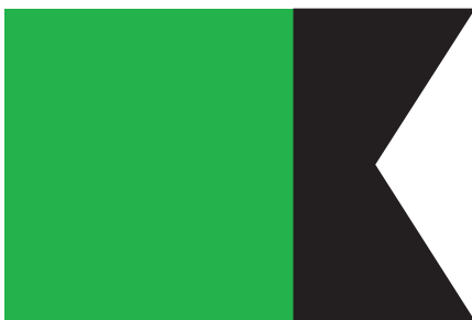
1-ша чота Окремої технічної сотні

До наказу долучені два чорно-білі малюнки. Один – представляє значок 1-ї сотні 10-го куреня, другий – кулеметної команди 12-го куреня. Обидва значки на них мають форму прямокутника з вирізом у вигляді „ластівчиного хвоста” з правого боку. Перший значок – білий з вертикальним червоним паском посередині (очевидно, кількість пасків відповідала номеру сотні в курені або чоти в технічній сотні), другий – розділений вертикально на дві частини, з яких ліва ширша (приблизно 2/3 ширини значка) має зелений колір, а права вузча – чорний. Однак малюнки, як і сам наказ, не дають повної інформації про лінійні („напрямкові”) значки в 4-й стрілецькій бригаді, зокрема, бракує розмірів самих значків і окремих елементів їх. У зв’язку з цим подані тут наші графічні реконструкції, не претендуючи на абсолютну точність, відтворюють лише їхній загальний вигляд.