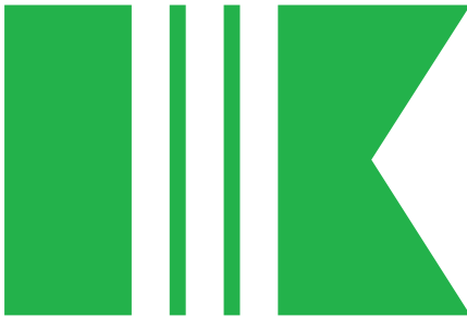
3-тя сотня 12-го куреня