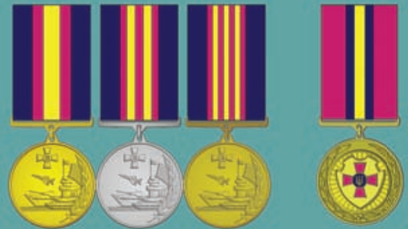
„За вірцевість у військовій службі” I ступеня II ступеня III ступеня