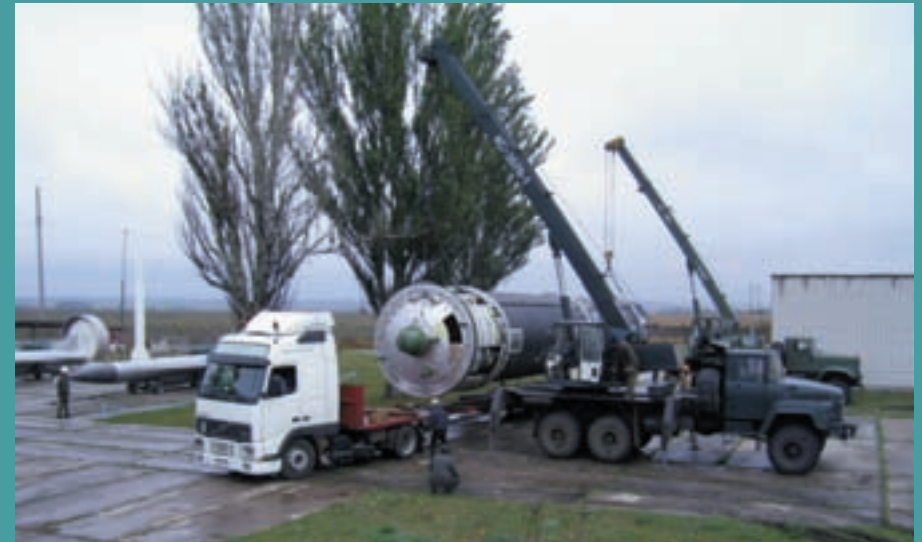
Монтаж експозиції Музею ракетних військ стратегічного призначення в Первомайську – філії ЦМЗСУ. Жовтень, 2006 р.