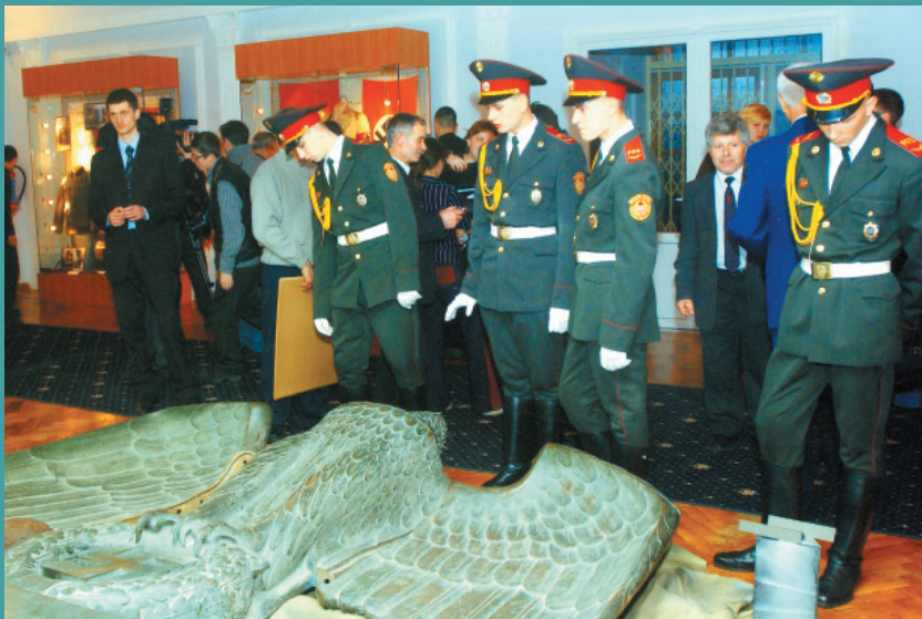
На виставці „Трофеї Червоної армії (1941–1945 рр.)” в ЦМЗСУ. Лютий, 2005 р.